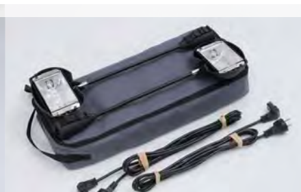
>Spots 150 W