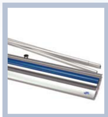
Placez la tige de support dans la cassette et tirez sur l'illustration – c'est tout!