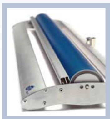
La cassette est légère, élégante et fonctionnelle.

Dimensions: 80x200 cm, livré dans un emballage de transport robuste.