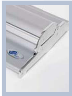
Roll Up Professional est un modèle un peu plus exclusif avec par exemple des têtes de vis insérées.