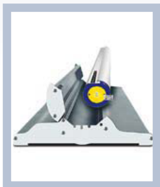
L'illustration est bien protégée pendant le transport.

Roll Up Classic a été récompensé par le jury de l'association Svensk Form qui lui a décerné le prix «Art utilitaire »! Ce système est facile à transporter et à mettre en place pour une présentation. Roll Up Classic se décline en plusieurs largeurs et peut être réutilisé dans des environnements divers.