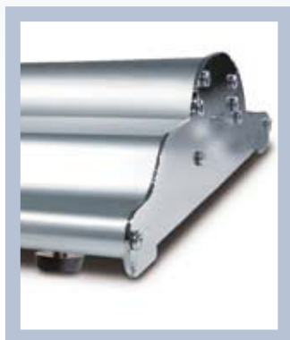
Une conception stable avec des pieds compensant l'inégalité du support.